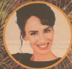
Anna Maria Kaufmann